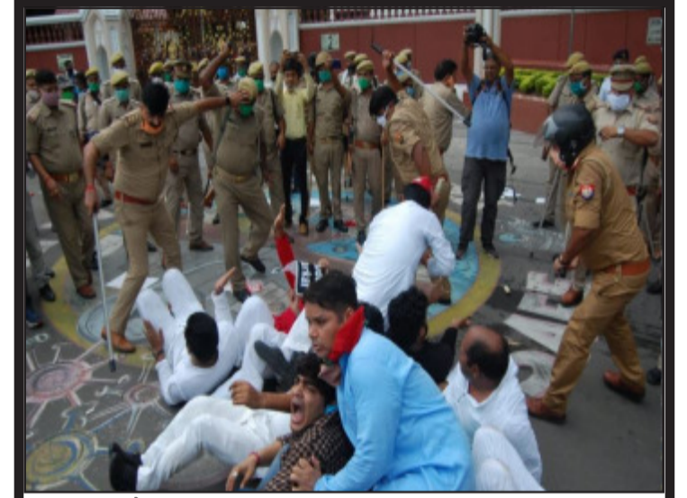
नीट और जेईई परीक्षा के विरोध पर राजभवन पर प्रदर्शन कर रहे सपा कार्यकर्ताओं पर लाठीचार्ज

अवस्थापना सुविधाओं के लिए 985 करोड़ रुपये, शिक्षकों के प्रशिक्षण के लिए 96 करोड़, दिव्यांग बच्चों की सुविधा व उन्हें समर्थ बनाने के लिए 50 करोड़, पुस्तकालयों के लिए 90.28 करोड़, छात्राओं को आत्मरक्षा के प्रशिक्षण के लिए 25.65 करोड़ रुपये आवंटित किए गए हैं। द्विवेदी ने बताया कि विद्यालयों में साफ पीने के पानी, विद्युतीकरण, जर्जर भवनों का पुनर्निर्माण व छात्राओं की सुविधा के लिए 27वीं तक के विद्यालयों में इंसीनरेटर की भी व्यवस्था की जाएगी। परिषदीय विद्यालयों में चल रहे आंगनबाड़ी केंद्रों को भी सुधारा जाएगा। छात्र-छात्राओं को कौशल विकास के लिए भी प्रोत्साहित किये जाने का भी प्रावधान इस बार किया गया है।