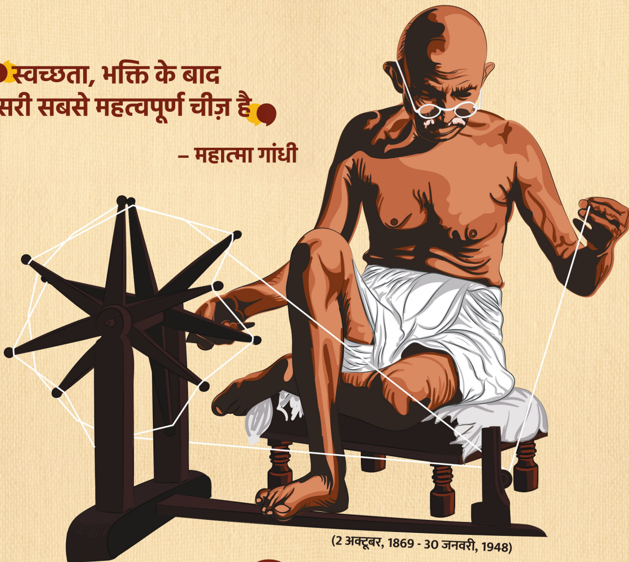
(2 अक्टूबर, 1869 - 30 जनवरी, 1948)